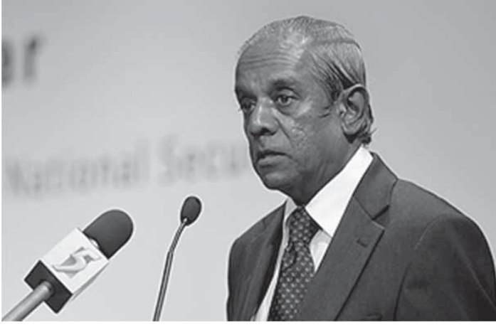
Prof S Jayakumar konuşma yaparken

Başkalarını kışkırtmak veya sorun yaratmak için yolumuzdan çıkmak istemiyoruz, ancak bu tür olaylar gerçekleştiğinde, sessizce beklemeliyiz. İkili sorun meydana gelmesi riskini önlemek üzere kolay yolu seçseydik, herkes hukuk sistemimizde biri kendi vatandaşlarımız için, diğeri yabancılar için olmak üzere çifte standart olduğunu düşünürdü. Daha geniş bir şema kapsamında, hukuk sistemimizin bütünlüğü ve yargımızın konumu, Singapur isminin zor kazanılmış değerleri arasındadır. Geçici siyasi kazanç için bunları görmezden gelmeyi göze alamayız. Yasalar devam etmelidir, ancak aynı zamanda ikili ilişkilerin raydan çıkmaması gereklidir. Bu, her iki ülkeden de sabır ve diplomasiye ek olarak Elçilerimizden medyadaki sorunlara ve huzursuzluğa karşı sakin kalınmasını istemektedir.