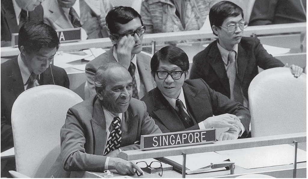
Sayın S Rajaratnam bir Birleşmiş Milletler Genel Kurul toplantısında

İşte bu yüzden benim ülkem bağlantısız olma yolunu seçti. Bunun anlamı basitçe, bizim kendi yaşam biçimimizi diğer ülkelerin yaşam biçimleri üzerinde empoze etmek isteyerek ittifak yapma yanlısı değildir. İki ülke arasındaki dostluk, aynı ideolojilere, dostlara ve düşmanlara bağlı olmamalıdır.