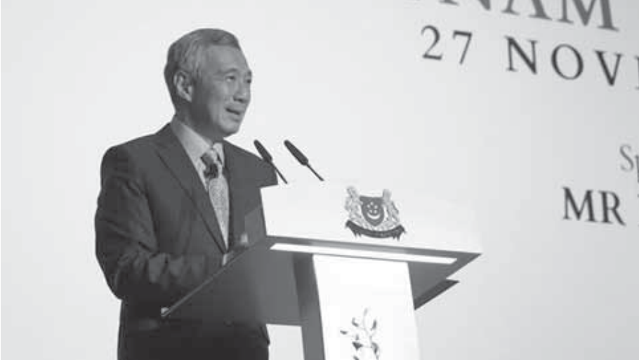
Sayın Lee Hsien Loong 2015 S Rajaratnam Konferansı'nda konuşma yaparken

50 yıl önce başladığımız yere kıyasla, Singapur'un dünyadaki konumu ölçülemeyecek derecede gelişti. Bugün Singapur başarılı ve saygın bir ülkedir. Uluslararası toplumda bu şekilde durmaktan keyif alıyoruz ve dünya çapında dostlarımız var. Bunun için, Dışişleri Bakanlığı görevlileri ve Bakanlar, bu konferans serilerine adı verilen ilk Dışişleri Bakanı Sayın S Rajaratnam'dan başlayarak teşekkürü hak ediyorlar.