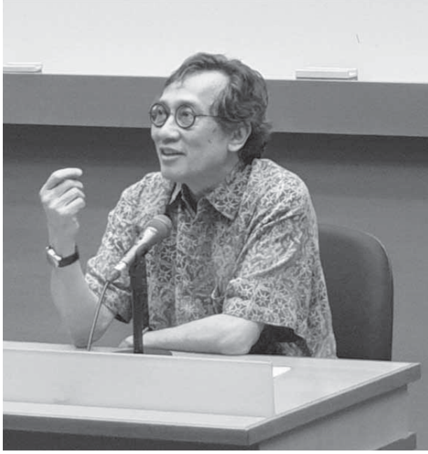
Sayın Bilahari Kausikan Singapur Ulusal Üniversitesi 'nde dinleyicilere Singapur Dış Politikası anlatırken

ASEAN'ın geçmişini anlamadığımız sürece, ASEAN aracının uygunluğunu yargılayamaz veya ASEAN'ın gelecekteki gidişatını göremeyiz. ASEAN'ın tarihinin büyük kısmı ASEAN üye ülkeleri ve ASEAN Diyalog Ortakları tarafından unutuldu. Bu konuşma ASEAN'ın tarihini çok geniş darbelerle çizecektir. Bunu yaparak, aksi halde yeterince vurgu alamayacak ve sadece bizim tehlike doğran nedenlerle göz ardı ettiğimiz ASEAN hakkında bazı temel gerçekleri daha açık hale getirmeyi umuyorum.