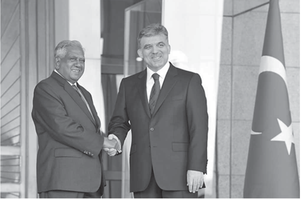
Sayın S R Nathan 2009 yılındaki Resmi Türkiye Ziyareti kapsamında (eski) Cumhurbaşkanı Abdullah Gül ile bir araya geldi

Daha sonra, Konfrontasi döneminin ardından, 1968'de Endonezya'daki ilk Büyükelçimiz olarak görevini üstlenen Rahmetli PS Raman gelmektedir. Öğretmen, gazeteci, halkla ilişkiler danışmanı, yayıncı ve hatta Yetişkin Eğitimi Kurulu Başkanı olarak çeşitli alanlarda geniş deneyime sahipti. Liderlerimize tavsiyelerde bulunma konusundaki görevini, politik tartışmalardaki kabiliyeti ve dürüstlüğü sayesinde başarılı bir şekilde yerine getirdi ve saygı topladı. Singapur Büyükelçiliğinin Ekim 1968'de isyancılar tarafından yağmalanmasının ardından gergin bir atmosferde sakin ve sürdürülebilir bir liderlik sağladı. Sakin ruhu, Jakarta'da her seviyedeki gerginlik ve öfke döneminde yerel bakanlar ve yetkililer ile iyi ilişkiler kurmasına yardımcı oldu. Kalp krizi geçirip Singapur'a geri dönene kadar ikili ilişkiler geliştirmek konusunda başarılı işler yaptı. Daha sonra, Canberra'da Yüksek Komiserlik yaptı ve ardından büyük bir kalp krizi geçirdiği Moskova'da Büyükelçi olarak görev aldı.