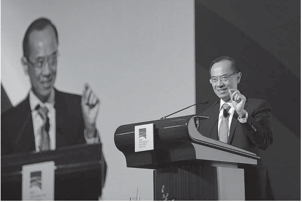
Sayın George Yeo S Rajaratnam Konferansı 'nda konuşma yapıyor

Bu disiplin dayatması, doğal değildir. Disiplin ortadan kalktıktan sonra veya daha yüksek kimliğin önemsiz olduğu durumda, derin kimlikler kendilerini öne çıkarır. Bunu, hareket için hazır bulunan NS askerlerinde görüyoruz. Ancak, iki yıl geçtiğinde, Singapur Silahlı Kuvvetleri (SAF) kimlikleri üzerindeki izlerini kaybediyor. Mobilize olduklarında, hızla tekrar bu kimliğe bürünebiliyorlar. Singapur'daki bu NS programlaması, özellikle acil durumlarda denizaşırı ülkelerde açık bir şekilde kullanılır.