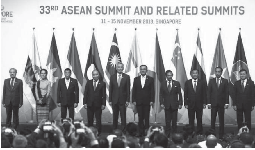
33. ASEAN Zirvesi Açılış Töreni, 2018

6 Bunun nedeni, ASEAN üyelerinin, ASEAN'ın parçalarının toplamından daha büyük olduğuna inanmasıdır. ASEAN üyeleri, on farklı ülke olarak ayrı yollara gitmek yerine tek bir kolektif sesle bir araya gelerek dünyadaki konumumuzu güçlendirdi. ASEAN aracılığıyla, ASEAN + 3 ve Doğu Asya Zirvesi gibi çeşitli ASEAN merkezli platformları kullanarak büyük ülkeler ve uluslararası kuruluşlarla bağlantı kurduk ve işbirliği yaptık. Önümüzdeki birkaç gün içinde bu forumlarda buluşacağız. Ekonomilerimizi entegre ederek halklarımızın bölgesel bir iş bölümünden faydalanmasını sağladık ve yatırımcılar nezdinde ASEAN'ın değer önermesini artırdık. Bugün ASEAN, dünyanın en canlı ekonomik topluluklarından biridir. Büyüyen bir orta sınıf ve genç bir işgücü ile ASEAN'ın, 2030 yılına kadar dünyanın dördüncü büyük ekonomisi olacağı öngörülüyor.