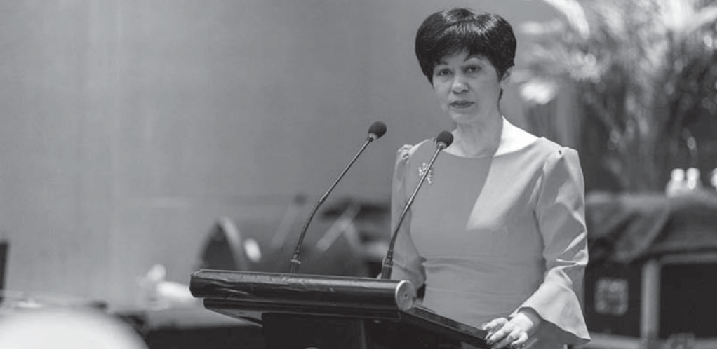
Sn Indranee Rajah 'Uluslararası Hukuk, Son Bir Yılın Gözden Geçirilmesi' Konferansı'nda konuşurken