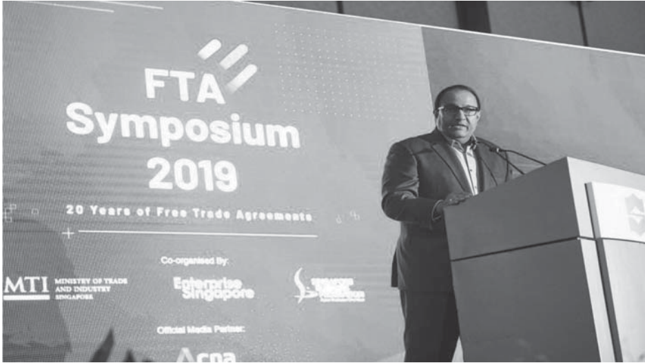
Sn. S Iswaran 2019 yılında STA Sempozyum 'unda konuşurken