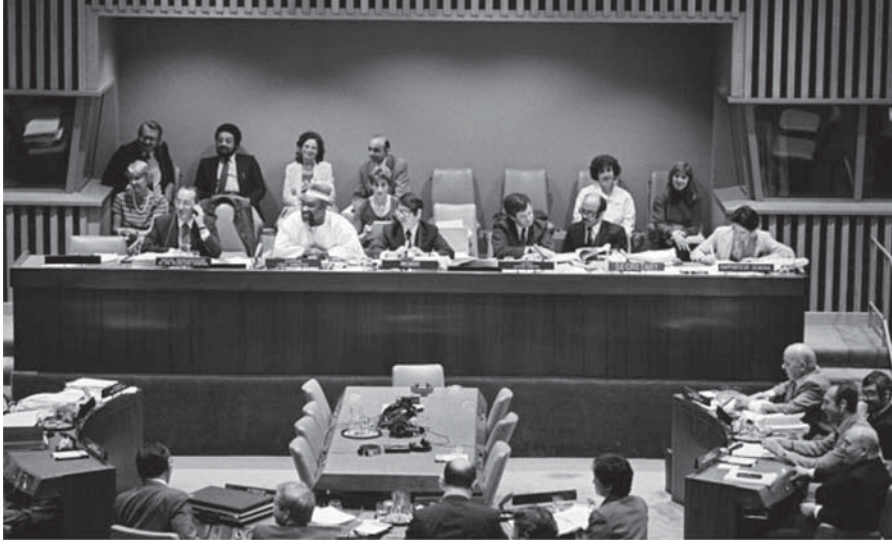
Profesör Tommy Koh (ortada), bir Birleşmiş Milletler Üçüncü Deniz Hukuku Konferansı toplantısına başkanlık ederken, 1982