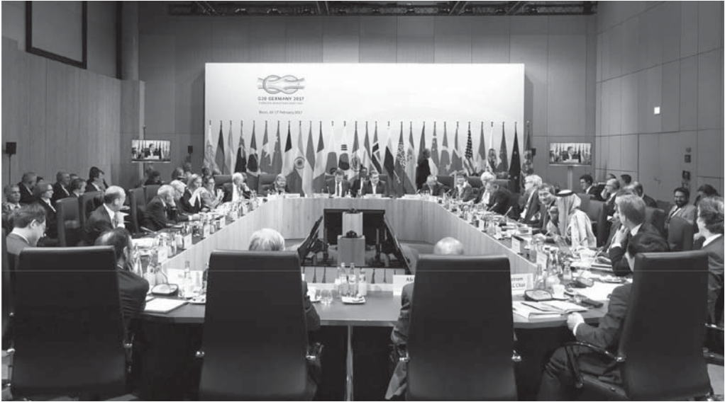
Küresel Yönetişim Grubu Dışişleri Bakanları, Bonn, Almanya'da bir toplantı yaparken, 2017

3 G20 ile ilgili bu gelişmeler, küresel ekonomi için genel olarak olumlu olmakla birlikte, küresel yönetişim alanında birtakım soruları gündeme getirmiştir. Bunlar, gelecekte küresel konularda kararların nasıl alınacağını, G20 sürecinin Birleşmiş Milletler (BM) için ne anlama gelebileceğini ve G20 tarafından alınan kararların dünyanın geri kalanını nasıl etkileyebileceğini içeriyordu. G20'nin oldukça tek taraflı davranışları, Singapur gibi nispeten küçük ama oldukça sağlam ekonomileri de ilgilendiriyordu. G20, dünyanın geri kalanı adına, sözde onlar için faydalı olan kararlar alırken, bazı kararları açıkça kendisine hizmet ediyor ve bunlardan etkilenen ülkelere herhangi bir şekilde danışılmadan alınıyordu. Küresel Yönetişim Grubu'nun (daha popüler olarak 3G olarak adlandırılır) ortaya çıktığı zemin buydu.