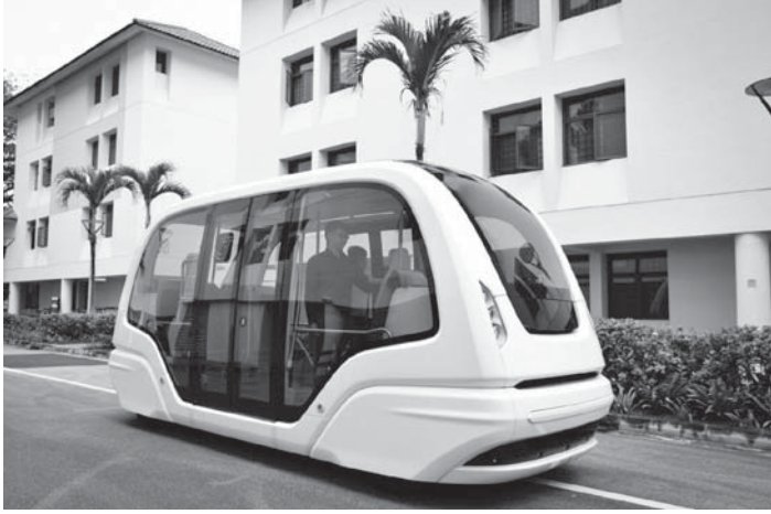
Singapur 'da toplu ulaşım biçimi olarak şoförsüz araçların kullanılması test edilirken

19 Üçüncüsü, ister fiber üzerinde geniş bant olsun, ister şehir trafiğimizi akıllıca yönetmek olsun, ister enerji kullanımımızda akıllı bir şebeke aracılığıyla daha verimli hale gelmek olsun, Singapur'u akıllı bir şehre dönüştürebilecek yenilikleri benimsemek üzere teknoloji konusunda uzmanlaşmalıyız. Teknolojiyi, uygulanabilir olduğu noktada, maksimum şekilde kullanmalıyız. Ancak halkımızı bunu yeni ekonomide gelişim sağlamak üzere kullanmaları için eğitmeliyiz - öğrencilerin nasıl öğreneceklerini öğrenmelerine yardımcı olmalıyız, çalışanlarımız arasında yaşam boyu öğrenmeyi teşvik etmeliyiz. Ve sonra teknolojiyi üretkenliği artırmak ve Singapurluların yaşamlarını iyileştirmek için kullanabiliriz ve onu bir kenara atamayız.