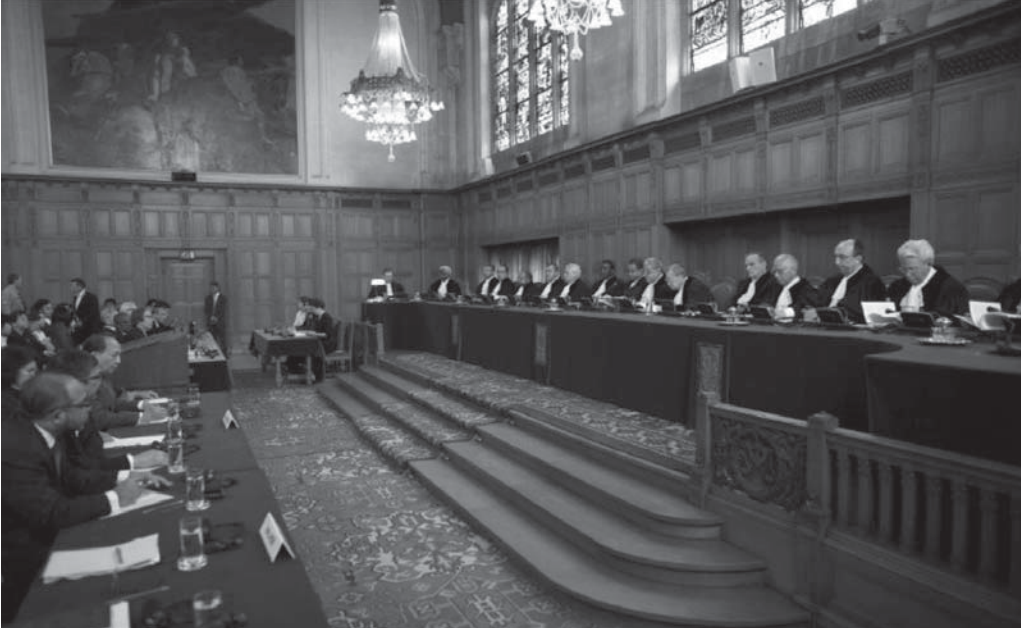
Uluslararası Adalet Divanı Hâkimleri Pedra Branca'nın özerkliği konusunda Singapur ile Malezya arasındaki uyuşmazlık konulu duruşmaya katılırken

7 Bunların hiçbirinin doğal bir durum olmadığını anlamak için bir an için düşünelim. Biz küçüğüz, ancak kendimizi çok daha büyük ülkelere eşit bir egemenlikte tutabiliyoruz. Egemenlik konusundaki anlaşmazlıkları sorunsuz ve barışçıl bir şekilde çözmeyi başardık ki bu, farklı durumlarda oldukça istikrarsızlaşan bir konu haline gelebilir. Diğer Devletlerin uluslararası anlaşmalarına uymalarını talep edebiliyoruz. Bu ancak tüm Devletlerin egemenlik eşitliği ve yasal gücünün olması sayesinde mümkündür.