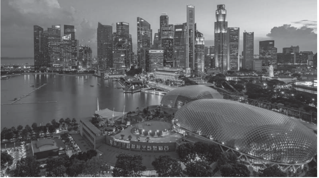
Uluslararası şirketlerin toplanma noktası olan Singapur'un Merkezi İş Alanının bir fotoğrafı

zaman kendi işimizi kendimiz yapmakla değil, işleri başkalarıyla birlikte yaparak, böylelikle sunabileceklerimizin en iyisini elde etmek için başkalarının güçlü yanlarından faydalanarak daha da geliştireceğimize inanıyoruz.