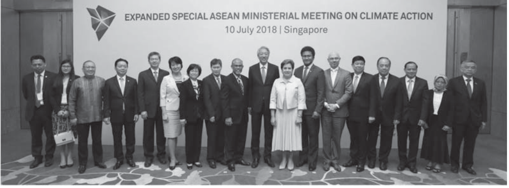
ASEAN Çevre Bakanları, ASEAN İklim Değişikliği üzerine Bakanlar Özel Toplantısı'nda Çin, Japonya, Kore Cumhuriyeti mevkidaşları ile BM İklim Değişikliği Çerçeve Sözleşmesi temsilcileri ile görüşüyor, Temmuz 2018

17 Diğer ülkelere teknik yardım sunmak için BM ile birlikte çalışıyoruz. Singapur'da bulunan ASEAN İhtisas Meteoroloji Merkezi gibi araştırma ve kurumlar aracılığıyla iklim değişikliği ve etkilerine dair kavrayışımızı artırmak için ortaklarımızla işbirliği yapacağız. Ayrıca, Uluslararası Sivil Havacılık Örgütü ve Uluslararası Denizcilik Örgütü gibi uluslararası kuruluşların emisyonları azaltma çabalarına katkıda bulunacağız. Bu bağlamda, BM Genel Sekreterine bu hafta İklim Eylem Zirvesi'ni topladığı için teşekkür etmek istiyorum; hem vakitli hem de gerekliydi.