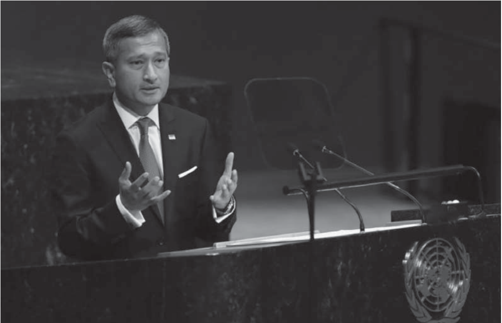
Dr Vivian Balakrishnan 2018 yılı BM Genel Kurulu'nda konuşma yaparken

5 Çok taraflılığın mükemmel olduğunu söylemiyorum. Tüm vaatlerini her zaman yerine getirmediğinin farkındayız. Ve açıkçası, her derde deva olarak gösterildiği zamanlar da oldu. O halde soru; çok taraflılığın bu hızla değişen jeostratejik bağlamda çalışmasını nasıl sağlayacağız.