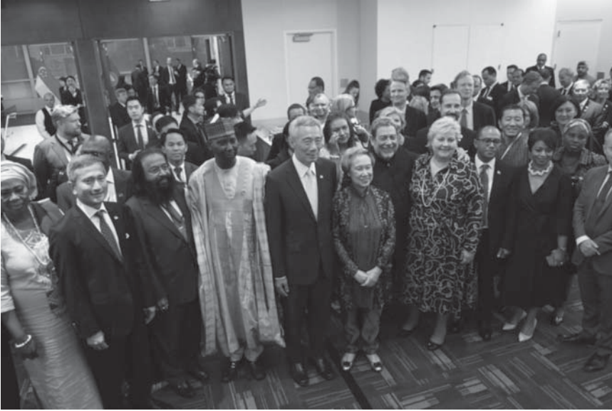
Sn. Lee Hsien Loong (ortada), 2019 yılında New York'ta FOSS'un 25. Yıl Dönümü vesilesiyle düzenlenen resepsiyona katılırken

5 Ancak, dünyadaki etkimizi artırmak için küçük devletler olarak ortak çıkarlarımızı ilerletmek amacıyla birlikte çalışmak zorundayız. Bu nedenle, küçük devletler olarak ulusların birliğine katkıda bulunmak için elimizden gelenin en iyisini yaptığımız önemli bir kurum olan BM'ye olan güçlü desteğimiz ve bağlılığımızda birleşiyoruz. FOSS üyelerinin BM'ye önemli katkılarda bulunduğunu belirtmekten memnuniyet duyuyorum. Birçok küçük devlet Güvenlik Konseyi'nde hizmet vermiştir ve önümüzdeki yıllarda da hizmet vermeyi ummaktadır. Bu yıl FOSS Üyeleri, Genel Kurul'un altı Ana Komitesinden beşine başkanlık ediyor. Küçük devletler BM'nin çalışmalarına katkıda bulunabilir ve bulunmalıdır da, çünkü güçlü bir BM ve sağlam ve istikrarlı çok taraflı bir sisteme sahip olmak bizim çıkarımızdır.